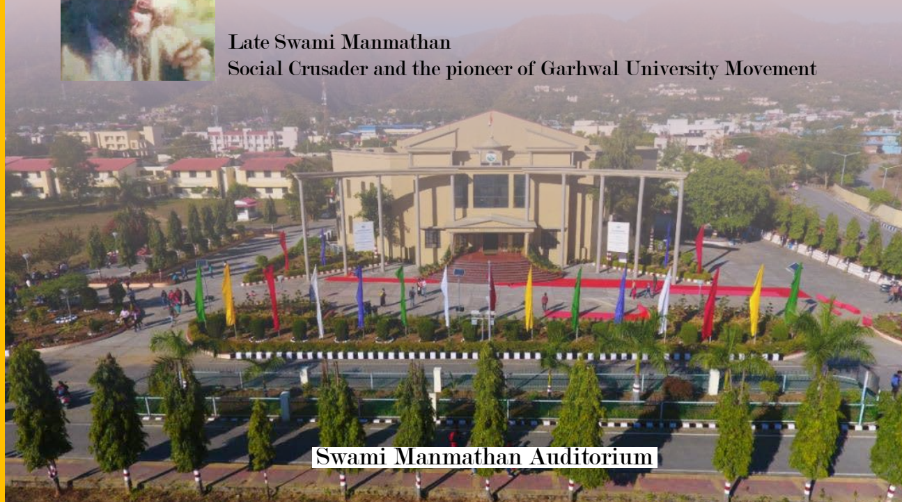
Swami Manmathan Auditorium