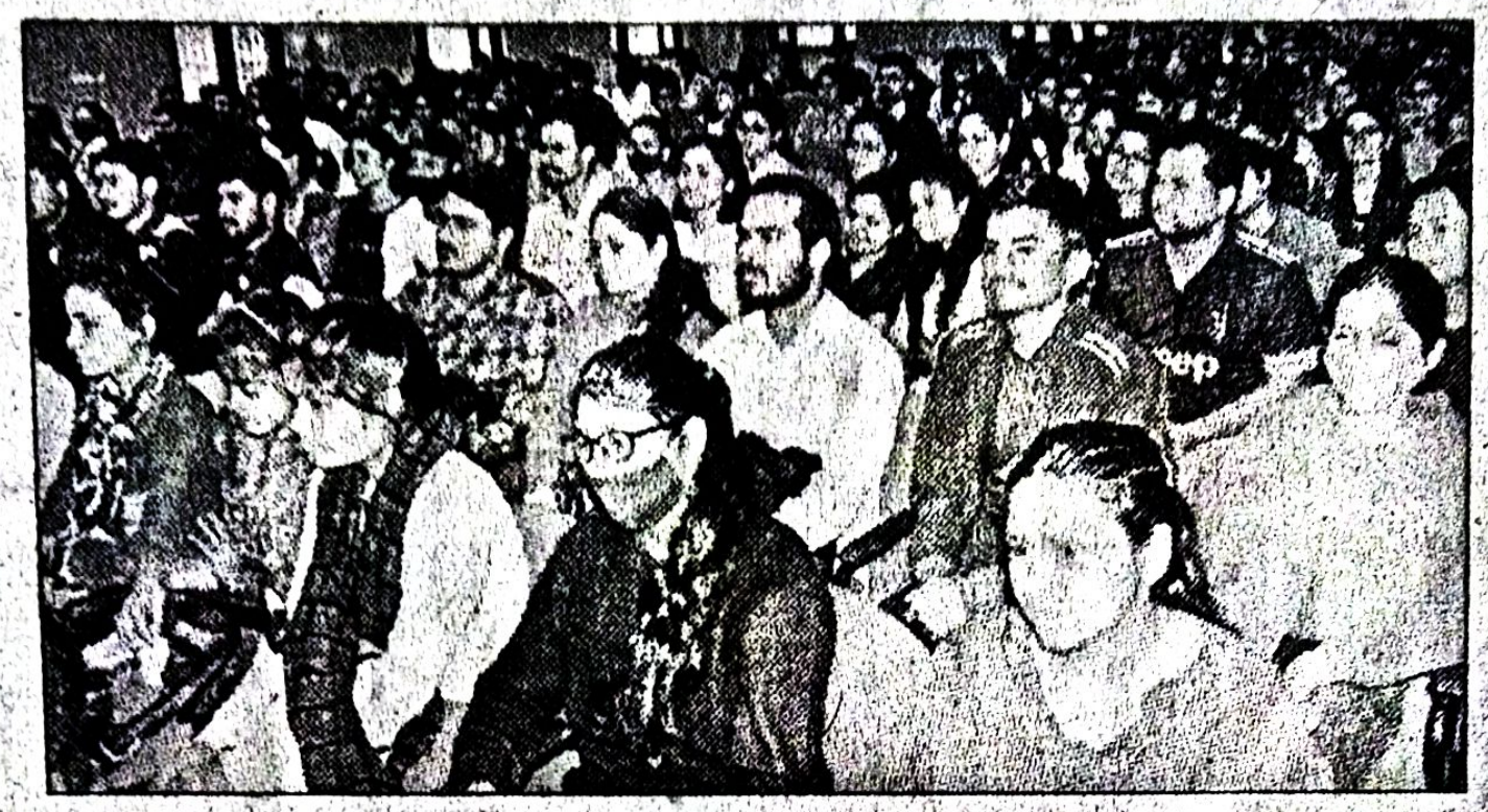
गढ़वाल वि वि के एसीएल हॉल में आयोजित कार्यक्रम में शामिल छात्र-छात्राएं। संबाद