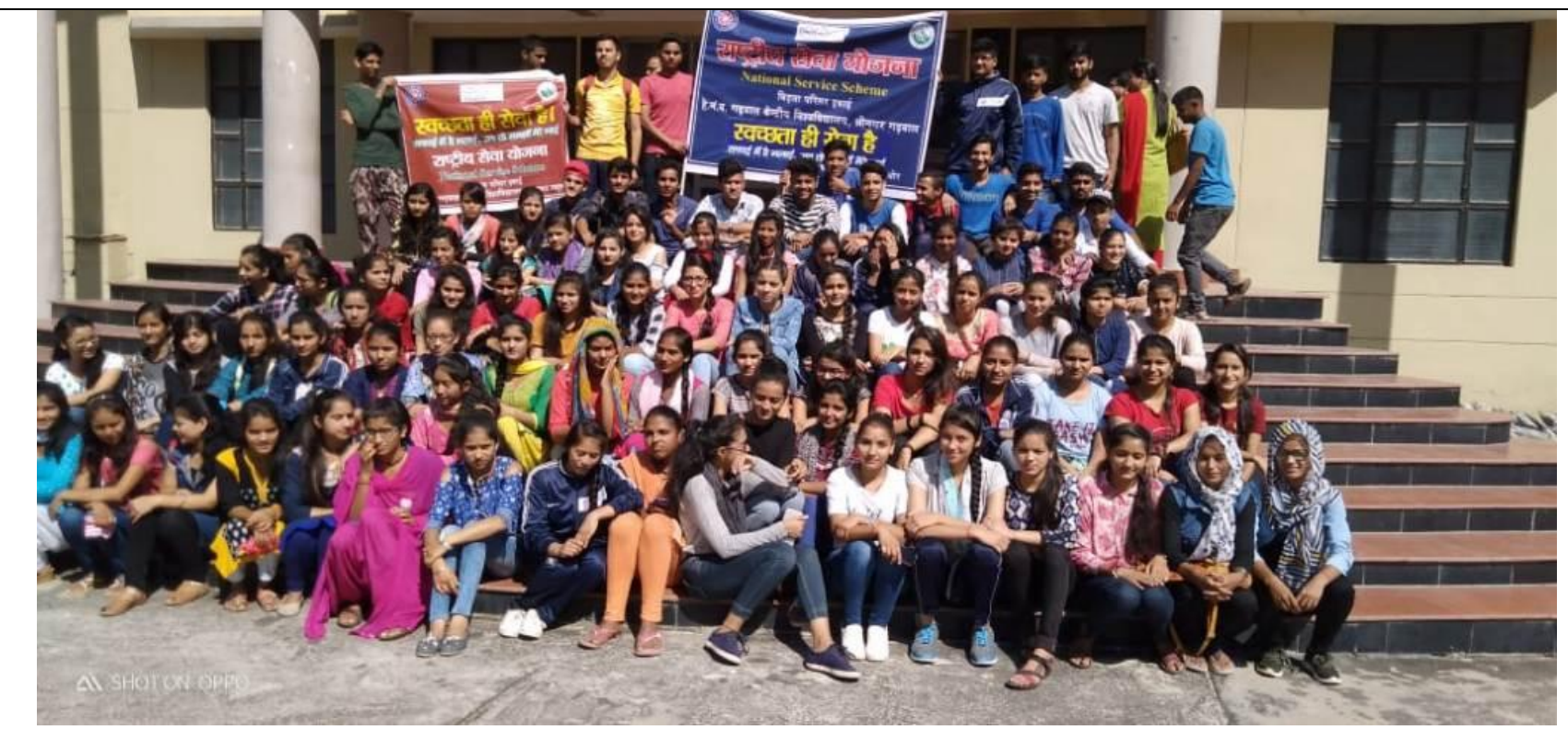
NSS Volunteers during Chauras Cleaning and Awareness/ Interaction with natives of Chauras on 02 October 2018.

Activities (other than Swachhta hi Seva hai ) by NSS- Birla Campus Unit, HNBGU