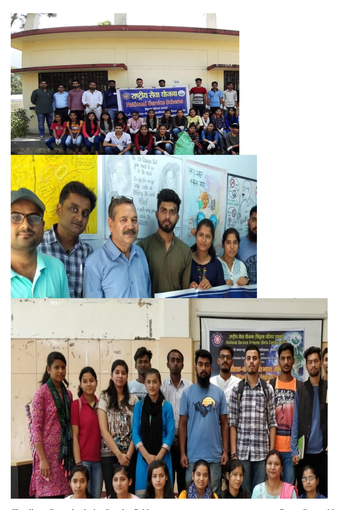
Cleanliness Campaignduring Swachta Pakhwara